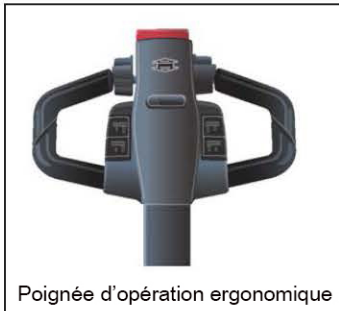
Poignée d'opération ergonomique