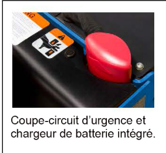
Coupe-circuit d'urgence et chargeur de batterie intégré.