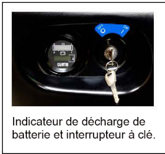
Indicateur de décharge de batterie et interrupteur à clé.