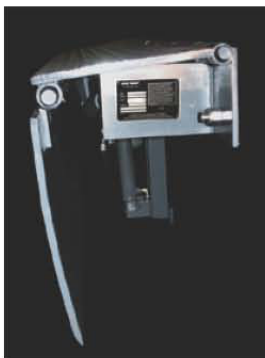
Position rangée de repos

Le niveleur monté-sur-rive hydraulique Série MD-CH de Blue Giant est idéal quand une installation en fosse n'est pas réalisable, ou quand des camions avec hauteur de plateau standard sont desservis au quai de chargement. La Série MD-CH est facilement installée sur le front du quai, fournissant une unité efficace avec rangement automatique, facile à utiliser avec le toucher d'un bouton.